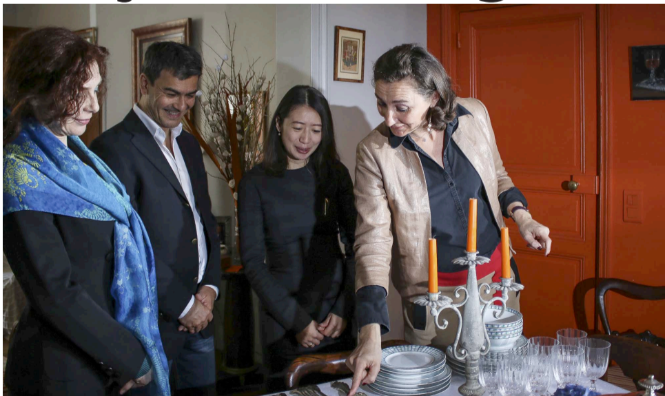
Connaître et placer les fourchettes est un art.

Les agences de tourisme ont rapidement trouvé l'idée très originale : «Elles veulent développer cette idée pour des touristes VIP chinois et américains par exemple.» Selon elle, l'art de vivre français est un moyen de découvrir notre patrimoine : «Derrière le vin, il y a les manufactures de cristal pour les verres, celles de faïence pour les assiettes...» Cette professeure des bonnes manières estime que Versailles se